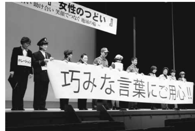
▲振り込め詐欺にだまされないように！

60歳以上の人を対象に、牧野の北播ドライビングスクールでドライバーズスクールが開催されました。まずは教室で高齢者運転の特徴や注意点、交通ルール再確認の授業を受け、その後教習車で運転技能チェックへ。助手席に乗った教習所の講師からアドバイスや注意を受けながら、数十年の車生活で“慣れ”になってしまっている点など、自分の運転の注意点を改めて確認しました。