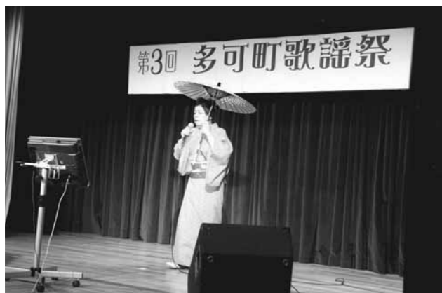
▲工夫を凝らしたステージに会場は大盛り上がり

普段なかなか発表の機会が少ないのだ自慢の祭典「多可町歌謡祭」を八千代プラザで開催しました。年々増える参加者も3回目を迎えた今年は20～91歳までの33組が参加。会場は立ち見続出の超満員で、観客の熱気に包まれました。出演者は応援に駆け付けた仲間から花束やレイなどを受け取りながら、自慢の歌声に加え、衣装や演出に工夫を凝らしたステージを披露しました。