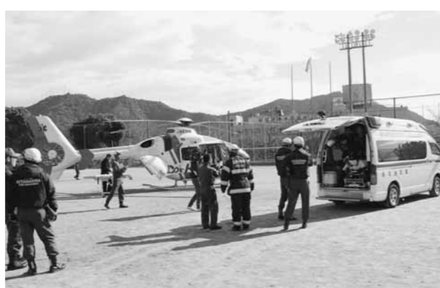
▲中央公園グラウンドでのドクターヘリと救急車との連携訓練