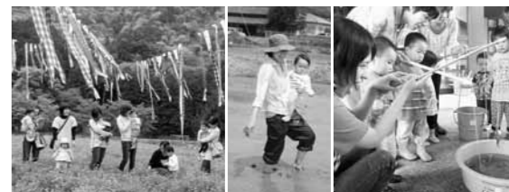
フロイデンやちよ 足立家の田んぼ(加美区) 交流会館