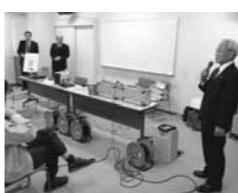
▲磁気ループシステムの説明会