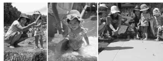
ハーモニーパーク 町民プール なか・やちよの森公園