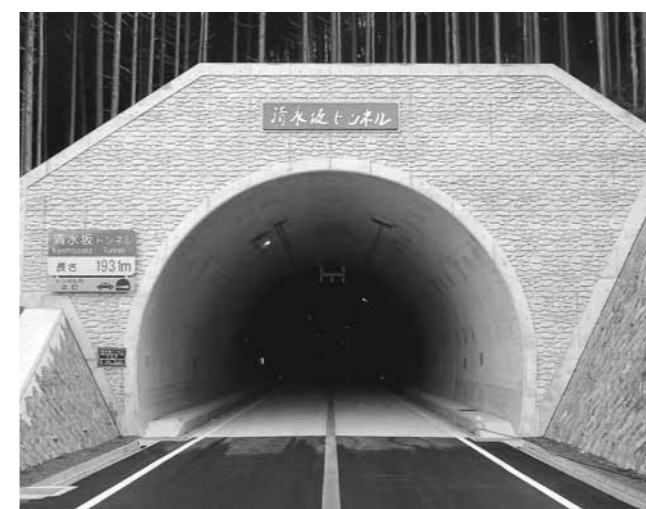
▲12月21日に開通した清水坂トンネル(多可町側)