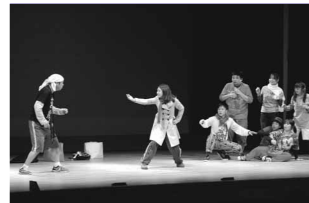
▲迫真の演技で観客を魅了

昨年に続き2回目となる「多可町子ども芸能祭」をベルディーホールで開催しました。今年も播州歌舞伎・和太鼓・ダンス・落語・エイサーなど町内で芸能活動を行う13組の子どもたちが大集合。大勢の観客を前に、ステージで日ごろの練習の成果を発表しました。子どもながらに、キレイのあるダンスや迫真の演技に、応援に駆け付けた大勢の観客からは大きな拍手が送られました。