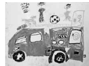
【はしご車って、かっこいいな!!】

なんかいもれんしゅうしました。ゆっくりていねいにかきました。“ん”のさいしょ、ななめにかくところにきをつけました。