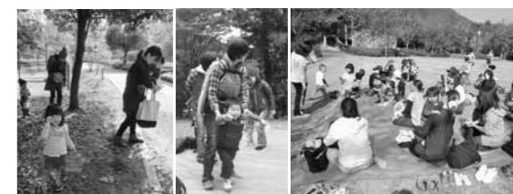
余暇村公園 竹谷山 毎月、おすすめの絵本や手遊びを紹介しています

遊び場所は毎月変わります。戸外遊びは、田んぼ・川・公園・山など自然の中で遊びます。家庭ではなかなか体験できないダイナミックな遊びも楽しさの1つだと感じています。室内遊びは、主にアスパルで遊びます。