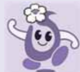
▲翠明湖マラソン マスコットキャラクター 「スイッピー」