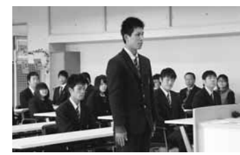
▲結団式で抱負を語る恋田くん(12月13日)

立候補で決まった23人の生徒たちは、現地の老人福祉施設や児童福祉施設などで交流会や奉仕活動を行いました。