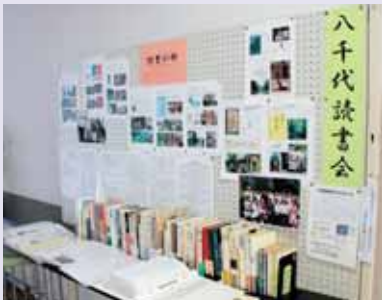
▲今までの活動の軌跡を展示

2人の先生を講師に、14人のメンバーで月に1回集まり、みんなで決めた本の感想などを話し合っています。また年に1回は読んだ本の舞台や作家にゆかりの深い土地へ旅行に行ったりもしています。