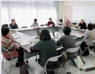
▲定例の読書会の様子