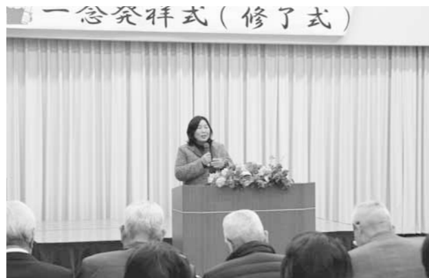
▲「歴史、自然、料理と本当に楽しい講座」と感想を話す受講生

「大学ゼミのような数学体験を」と今年で18回を数える人気の講座。今年も会場いっぱいに集まった約60人の参加者は、各教授が用意した趣向を凝らした問題の数々に頭を抱えながらも、ヒントをもらいながら問題を解く楽しさを体験しました。