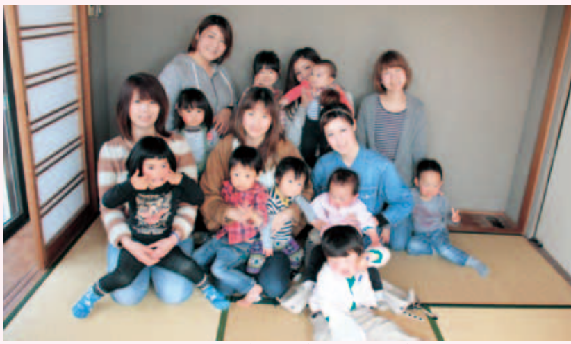
▲「一人ではできないことも、みんなが集まればいろんなことができます」と話す皆さん