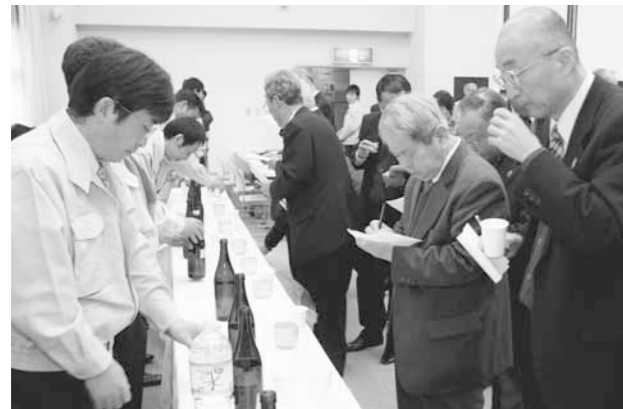
▲審査用に少量仕込みで醸造された日本酒で利き酒審査を行います

フェアでは日本酒をめぐる情勢や昨年の山田錦の品質の解説などが行われました。またコンクール入賞の良質米を試験醸造した利き酒審査が行われ、各生産者が工夫を凝らし栽培した山田錦が日本酒になったときの味や香りの違いを話し合いました。