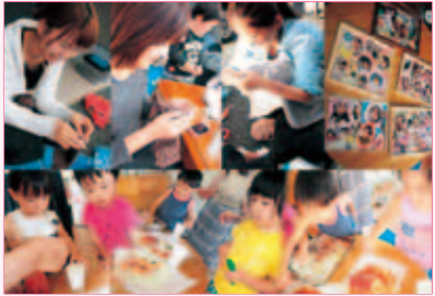
▲それぞれの趣味をみんなで楽しみます