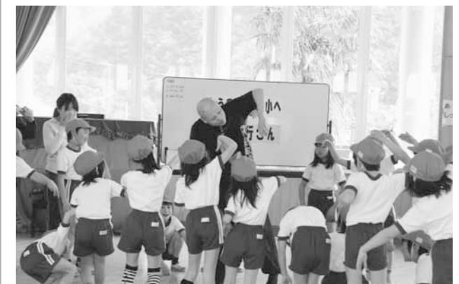
▲糸で引っ張られる人形の動きを表現