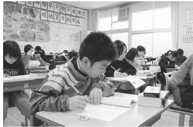
▲真剣に検定に取り組む高学年の児童

昨年度、実行委員会が112ページにおよぶ「杉原谷ふるさと百科」を制作配布。その中から学年に応じて問題を作成し、検定が実施されました。この日は全校児童と希望した保護者が受験し、地域の自然や歴史、集落名の由来や行事などふるさと百科を使って勉強したふるさとの知識を試しました。