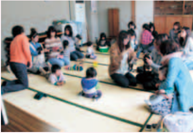
▲写真屋さんの協力で開催したカメラ教室

毎日の子育てに笑顔を 親も子どももみんな一緒に笑って楽しむ 子育て中でもできることがある