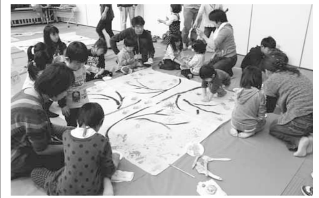
▲杉原紙の大きなキャンバスに自由に描いていきます