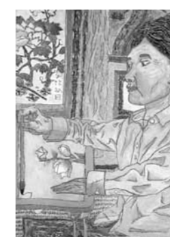
いなみの学園長賞