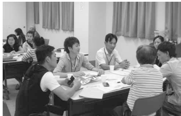
▲和やかな雰囲気のある教室【問合せ：生涯学習課☎(32)5122】

10月1日の日本酒の日コンサートに先駆けて、「山田錦・日本酒フォーラム」をバルディーホールで開催しました。 フォーラムでは、今年の登紀子ブランド酒「愛を耕すものたちよ」が発表され、その後加藤登紀子さんをはじめ酒造メーカー、山田錦生産者ら8人が山田錦の消費状況や将来性など、日本酒の未来について意見交換を行いました。