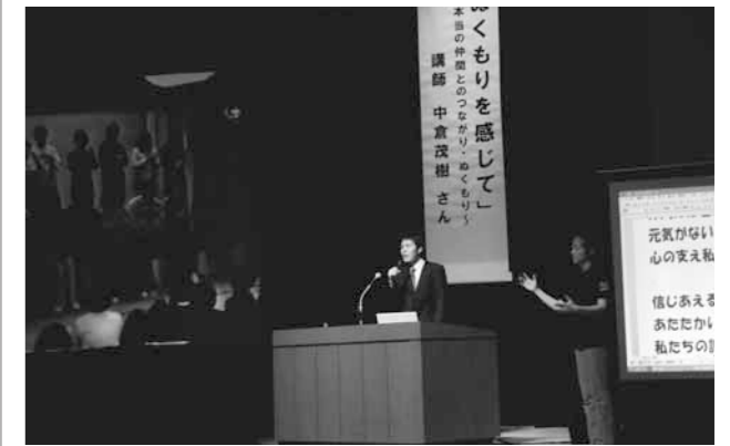
▲自ら体験した部落差別などを交えながら語る中倉さん

夏の子ども体験学習「なつチャレ2014」のプログラムのひとつ、「手作り絵本を作ろう」を図書館で開催しました。 今回は2日間かけて、動物たちが麵類をすすっている立体絵本「ちゅるるんアニマル」という絵本を作りました。参加した19人の子どもたちは、好きな色を塗って紙を貼ったり重ねたりして、楽しみながら自分のオリジナルの絵本を完成させていました。