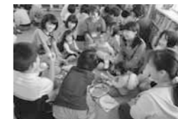
乳幼児と遊んだり、お母さんから子育ての話を聞いたりします