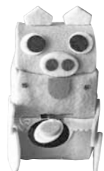
【子ぶたのお母さん】