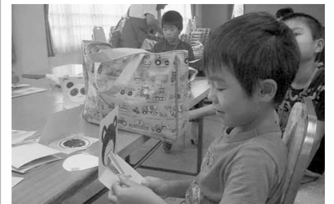
▲完成までもう少し！