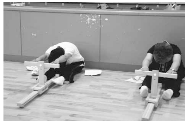
▲長座体前屈に挑戦

多可町スポーツDAY事業の一環として、アスパルで「体力測定」を開催しました。 64歳以下では反復横跳びやシャトルラン、65歳以上では開眼片足立ちや6分間歩行など年齢ごとに設定された6項目をテスト。結果を見た参加者は「自分の体力の現状を知ること、健康を考えるいいきっかけになった。今後も健康に過ごすために、生活を見直したい」と話しました。