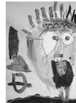
老人クラブ連合会長賞