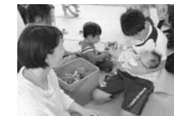
緊張しながら赤ちゃんを抱っこ