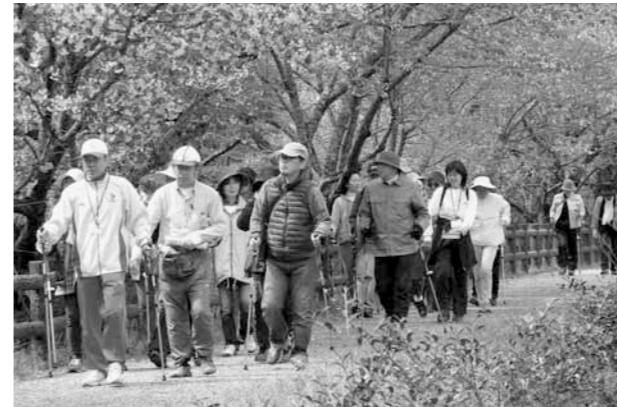
▲ 野間川沿いをのんびりウォーキング

町スポーツ推進委員会が多可町スポーツDAY事業の一環として、「ふるさとお花見ウォーク」を開催しました。コースは、八千代プラザからフロイデン八千代・はたるの宿路・極楽寺を巡る往復約5.8キロ。通過ポイントでは多可ふれあいボランティアガイドによる説明も行われ、41人の参加者はそれぞれのペースでウォーキングを楽しみました。