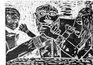
『友達とのうですもう』

この絵で工夫した所は魚を大きくかいていろいろな色を使った所です。地面の色をつくるのがむずかかったです。みんなでいった魚の棚、楽しかった。