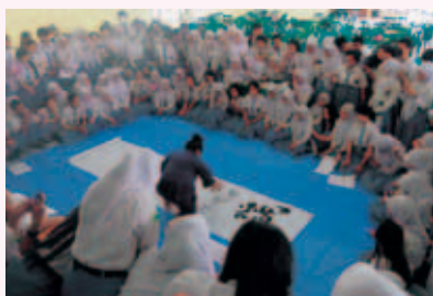
▲ インドネシアの学校でワークショップ・パフォーマンスを行いました

『ありがとう』と言われる喜び 一人でも多くの人の笑顔につなげるため 一筆一筆に魂を込める