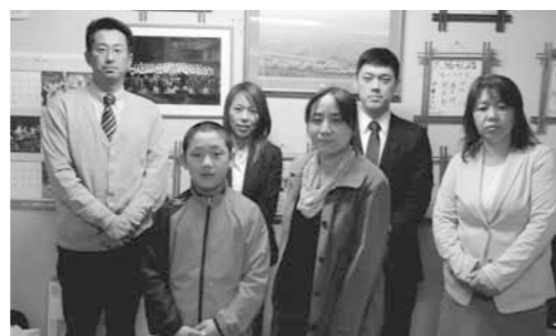
▲スポーツ賞受賞者の皆さん(代理、欠席含む)

ぼくは、はん画で森を歩くトカゲを作りました。むずかしかったところは、葉っぱのもようです。細かいところは、線が重ならないようにしました。