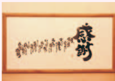
▲ 1畳の大きさの大作。4月25日にオープンした杉原紙の里「展示・体験工房」で企画展を開催中(6月7日まで)