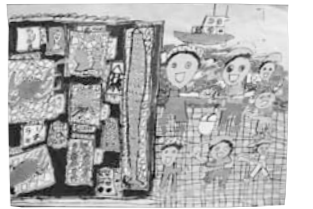
『魚の棚で魚を買ったよ』