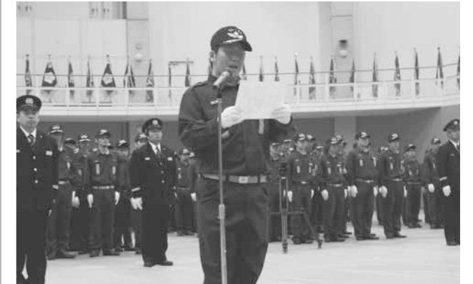
▲ 12分団59部で編成、総勢1,082人で組織